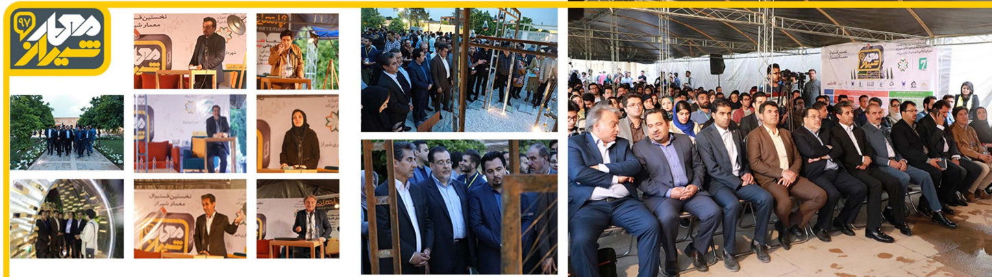
مراسم افتتاحیه نخستین فستیوال معمار شیراز با حضور شهردار شیراز و اعضای شورای اسلامی شهر شیراز و معماران برتر