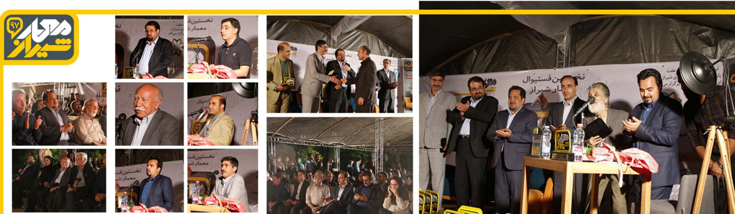
مراسم اختتامیه نخستین فستیوال معمار شیراز با حضور اعضای شورای شهر، مدیر کل دفتر فنی استانداری و پیشگسوتان معماری