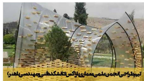
تیم طراحی انجمن علمی معماری یازگس دانشکده فنی و مهندسی باهنر