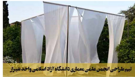
تیم طراحی انجمن علمی معماری دانشگاه آزاد اسلامی واحد شیراز