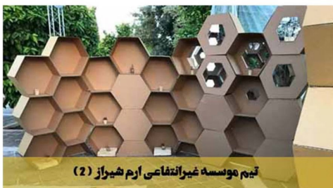
تیم موسسه غیرانتفاعی ارم شیراز (2)