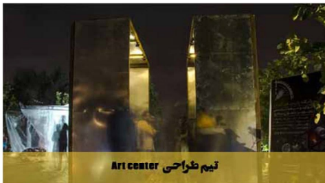
تیم طراحی Ari center