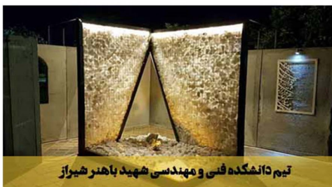
تیم دانشکده فنی و مهندسی شهید باهنر شیراز