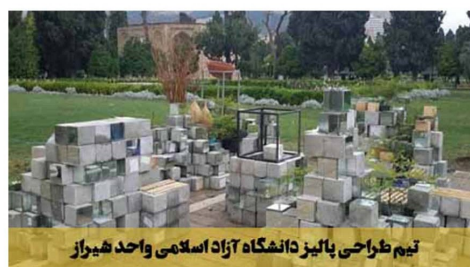
تیم طراحی پالیز دانشگاه آزاد اسلامی واحد شیراز