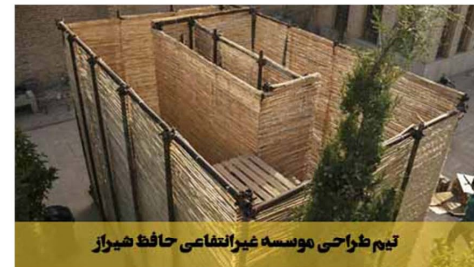
تیم طراحی موسسه غیرانتفاعی حافظ شیراز