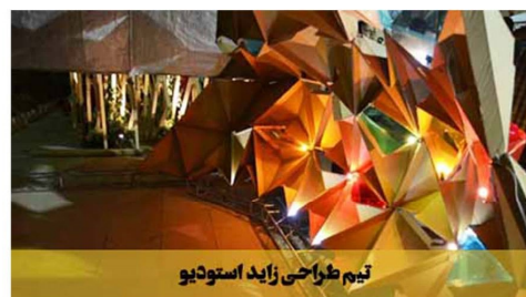
تیم طراحی زاید استودیو