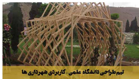
تیم طراحی دانشگاه علمی - کاربردی شهرداری ها