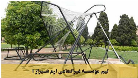
تیم موسسه غیرانتفاعی ارم شیراز ۱