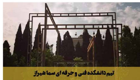
تیم دانشکده فنی و حرفه ای سما شیراز