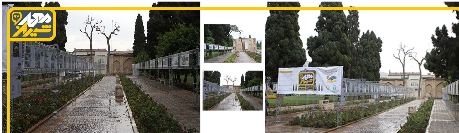
نمایشگاه آثار معماری نخستین فستیوال معمار شیراز