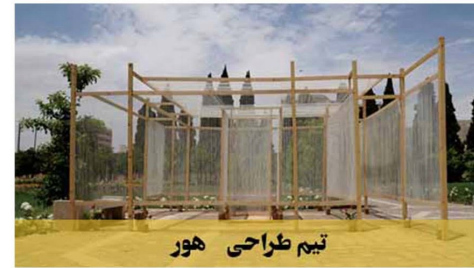
تیم طراحی هور